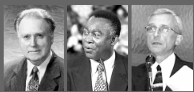
Ян Полсен, президент на световната адвентна църква

Пастор Ян Полсен, президент на световната адвентна църква, ка-